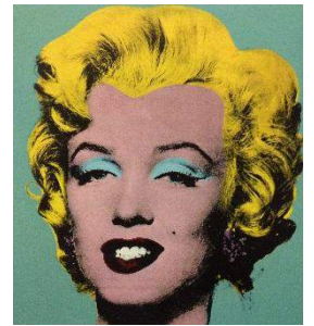
Andy WARHOL, Marylin, 1964