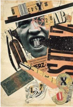
Raoul HAUSMANN, ABCD, 1923-24

Quelle est la technique utilisée pour chaque œuvre ? Reliez chaque œuvre à la bonne réponse (attention, il y a un intrus).