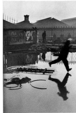
Henri CARTIER BRESSION, Derrière la gare Saint Lazare, 1932